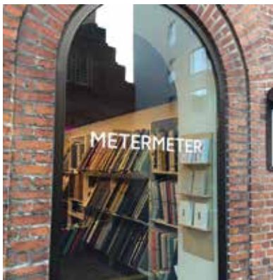
Metermeter Hans Hartvig Seedorffs Stræde 3-5, 8000 Aarhus