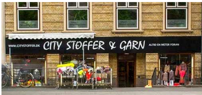
City stoffer Park Allé 9, 8000 Aarhus