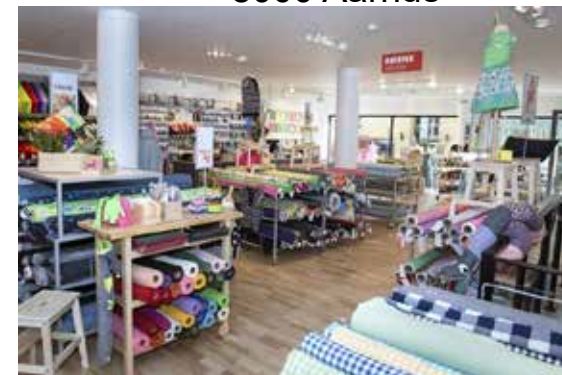
Stof 2000 J. M. Mørks Gade 1, 8000 Aarhus