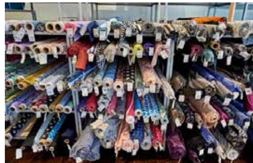
Stof 2000 Møllegæ 6a, Aalborg