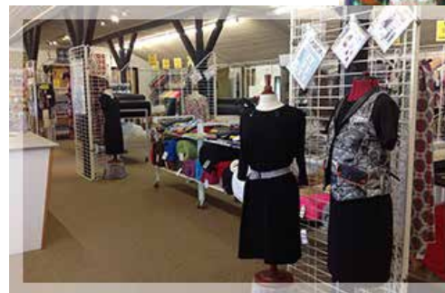
Stofgården Løvvænget 3, 7470 Viborg