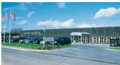
Stof og Stil Tilst Søndervej 94, 8381 Tilst