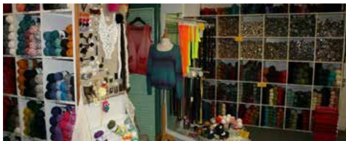
Stofstedet Hobrovej 18, Rold 9510 Arden.