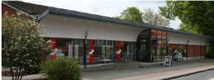
Stof – Sycenter Bredgade 73 6920 Videbæk