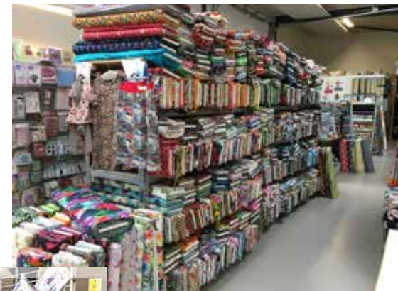
Kølkær stof og hobby Hammerum Hovedgade 130 C